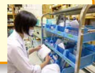
配薬カートへのセット