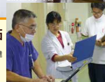
脳神経外科の回診